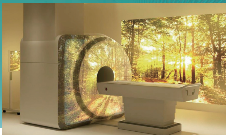
MRIアンビアンシステム