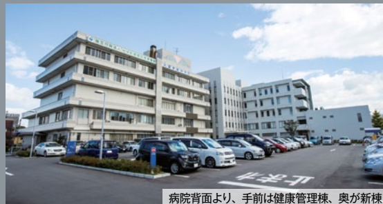
病院背面より、手前は健康管理棟、奥が新棟

JCHO久留米総合病院は、1946(昭和21)年に「福岡県健康保険第一病院」の名称で開設された施設を嚆矢とする。その後、健康保険病院経営の一元化とともに1965年に(社)全国社会保険協会連合会「社会保険久留米第一病院」と改称し、開設以来、久留米市内唯一の公的病院として地域医療に貢献している。1991年に健康管理センターを、1996年には老人保健システム「プレジールくるめ」を新設し、医療、保健、福祉の三位一体による複合医療施設である。