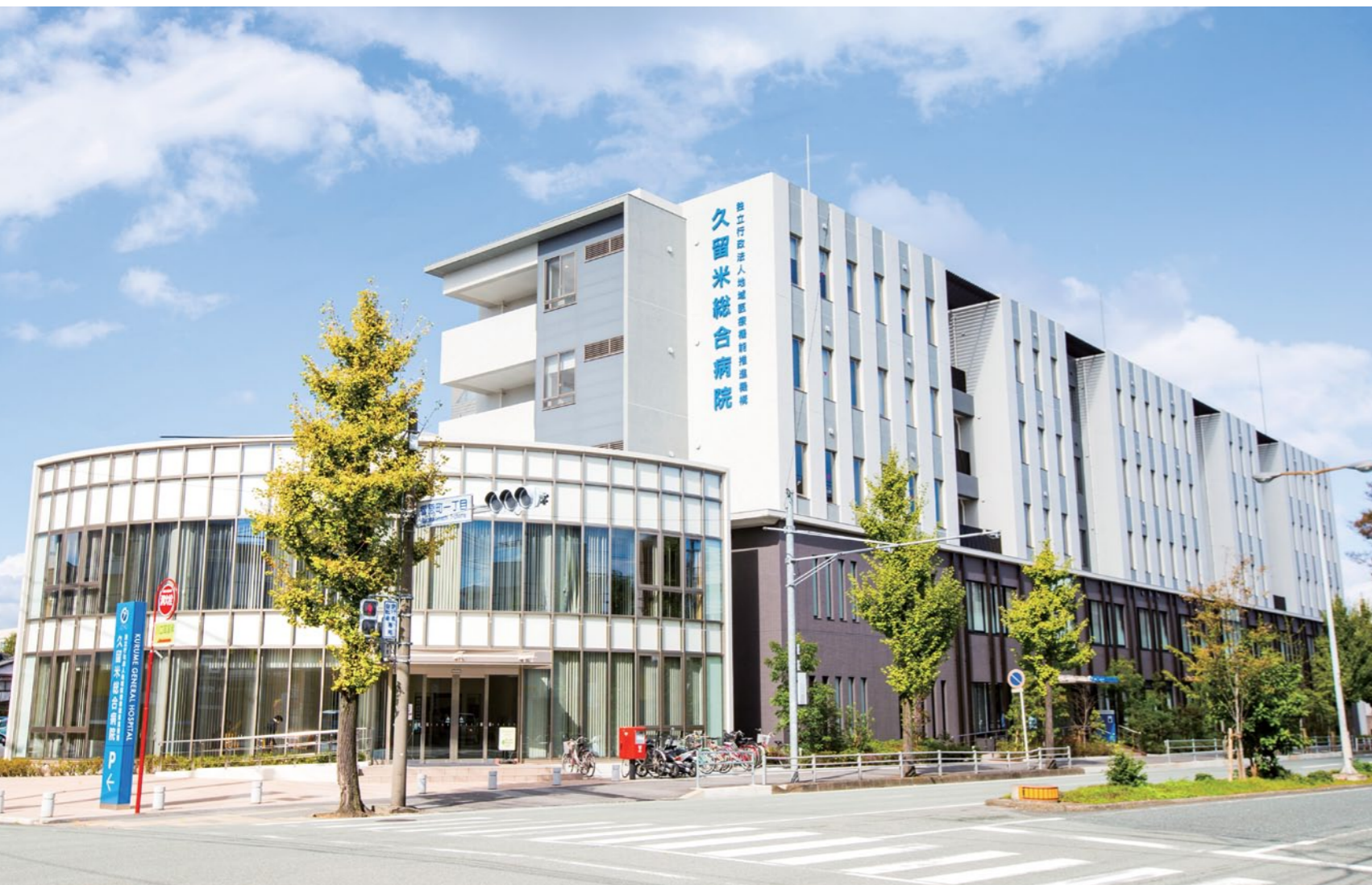
2015年11月に竣工した新診療棟。地上5階、地下1階の建物に病床数175床と規模を拡張し、先進の医療機器とアメニティに配慮した設計を取り入れている

同プロジェクトがスタートした当時、クラウド型の電子カルテを導入していた病院が当院だけだったために、本部の担当が見学を訪れたのですが、クラウドシステムに対応したWeb型電子カルテを導入したことについて非常に褒めていただきましたね。