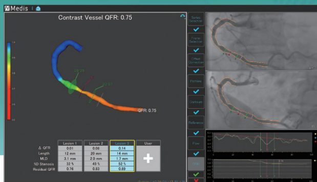
定量的冠血流比解析プログラム「Medis QFR」

アンギオ画像のみで冠動脈の定量的冠血流比が算出可能な「Medis QFR」などの解析用プログラムや、画像の保存・配信に留まらないCardiology総合管理ソリューション「Goodnet」の実機評価が可能。また、多様なテンプレートと柔軟なカスタマイズが強みのレポートシステムでは、単なる記録にとどまらない臨床や研究での導入事例を紹介する。