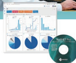
モニター管理ソリューション「RadiNET Pro」

EIZOグループは、医療現場の各分野に役立つ映像環境を提供し、医療の質の向上に貢献する。