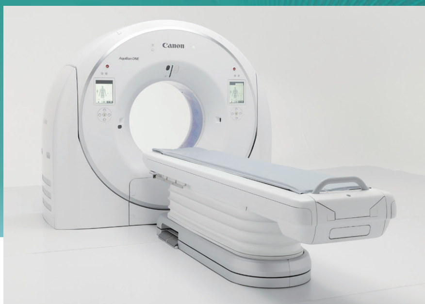
CTスキャナー 「Aquilion ONE / INSIGHT Edition」

キヤノンメディカルシステムズは、AIソリューションブランド〈Altivity〉のもとに集結したAI技術により、医療データの高品質化・オペレーションの最適化を更に進歩させ、迅速な治療方針の決定を支援し、一人ひとりに最適な質の高い医療の実現を目指す。同ブランドがもたらす、さらなる臨床、運用、経営の価値とともに、最新技術を搭載した製品やさまざまなソリューションを紹介する。